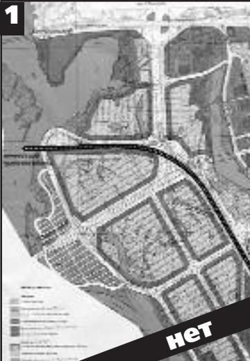
Застройка территории садов многоэтажными домами.

ДАЧИ В БЫКОВНЕ — БИЗНЕС НА КОСТЯХ! Еще одно место, на котором киевские власти могут предложить дачные участки в обмен на Ваши деньги — это земля в районе Быковнянского леса (пгт. Быковня). Однако, как пишет газета «Зеркало недели», 70 лет назад решением киевских землеустроительных служб столичной НКВД был выделен участок Дарницкого лесничества вблизи с. Быковня. Почти до самой оккупации нацистами Киева в сентябре 1941 г. неподалеку от Черниговского шоссе в обстановке строжайшей секретности работал конвейер НКВД по захоронению граждан. После расстрела в Лукьяновской тюрьме и подвалах бывшего Окресенского двора культуры тела людей ночными рейсами полугорки перевозили в Быковнянский лес для захоронения. Иными словами, нам с Вами предлагают участки на костях десятков тысяч наших сограждан, замученных во время сталинских репрессий. Да еще и сделать это священное место предметом торгов с владельцами участков на Русановских Садах — ведь на этом месте уже планируется возведение Мемориала памяти жертв политических репрессий. Поэтому, если Вы не хотите провести остаток жизни в лесу на моглах замученных киевлян — не соглашайтесь на предлагаемые участки в районе Быковнянского леса!