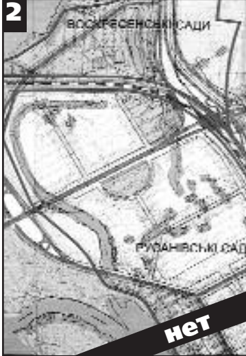
Разбивка садов на кварталы с коттеджной застройкой участков по 10 соток

Городские власти под предлогом строительства мостового перехода планируют незаконное отторжение наших участков, предлагая взамен заведомо непригодные для этого земли на Горбачихе и в Быковнянском лесу. Территорию ОСТ «Русановский массив» они собираются отдать застройщикам с целью последующей продажи квартир в многоэтажках состоятельным клиентам ОСТ «Русановский массив» в этом варианте подлежит полной ликвидации.